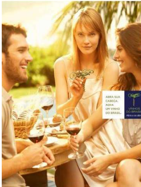
Identidade Visual 2010\2011\2012: