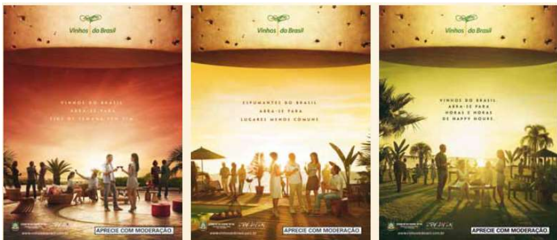
Identidade visual 2013\2014: