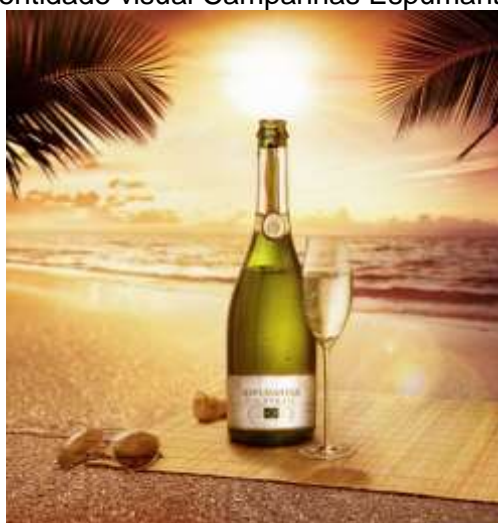
Logomarca Brasil Espumantes: