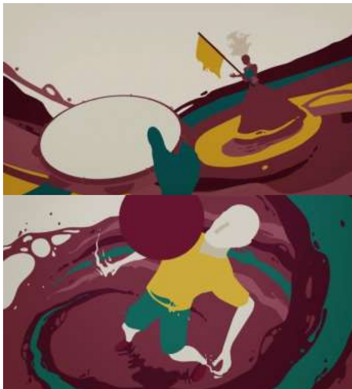
Identidade visual Campanhas Espumantes: